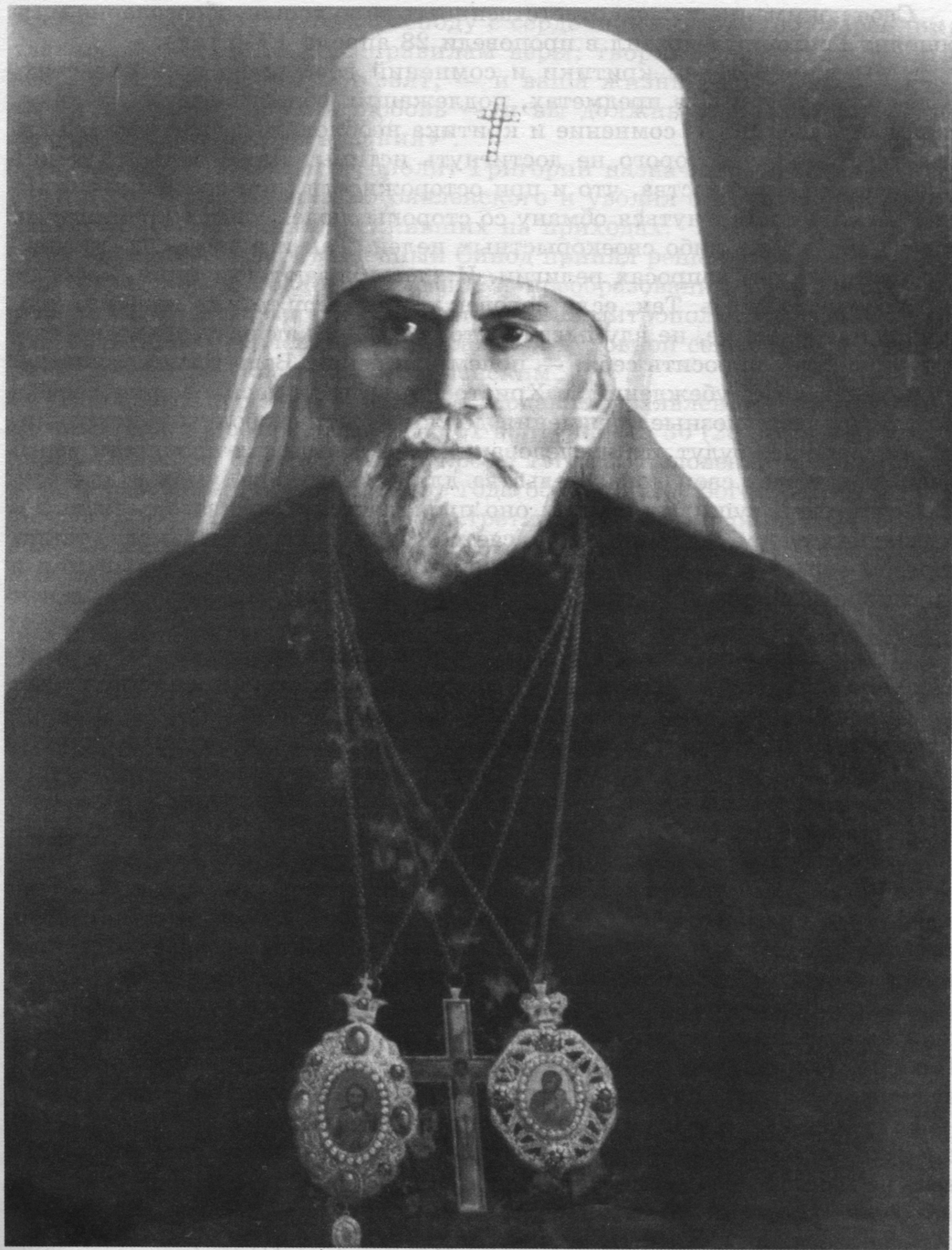
Митрополит Ленинградский и Новгородский Григорий (Чуков)