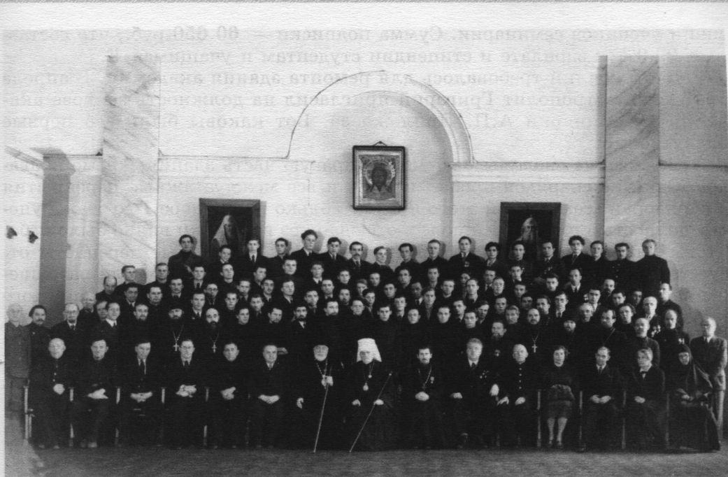
Общая группа профессоров, студентов и учащихся ЛДА и С. Фото конца 1940-х годов