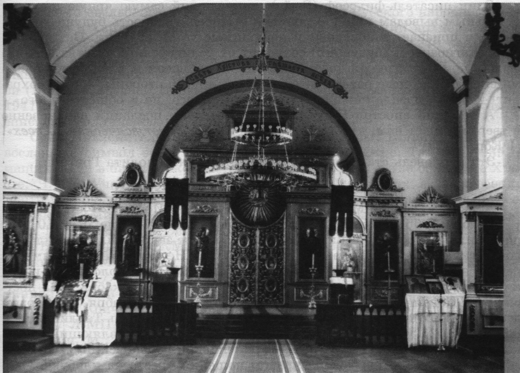
Интерьер академического храма Апостола и Евангелиста Иоанна Богослова. Фото 1952 года

в темные массы, бросать обвинение только духовенству, тому духовенству, которое на своих плечах пронесло первые зародыши просвещения на родную Русь и создавало школы для просвещения народа. И наша задача теперь — заботиться об углублении понимания истинного нравственного учения Христа и очищения его от искажений и извращений.