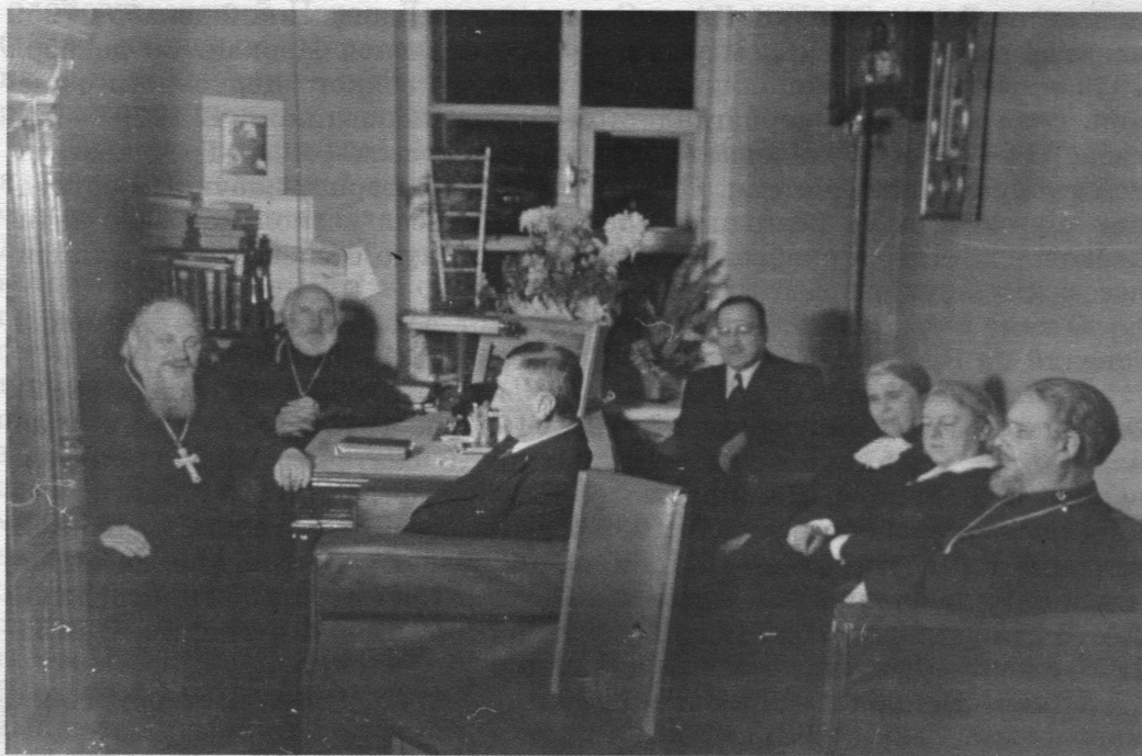
В профессорской после лекций

щика в церкви с. Рождествено Гатчинского района, с 1 ноября 1951 служил в Спасо-Парголовской церкви, с 24 января 1952 — настоятель Александро-Невского храма г. Красное Село, с 2 июля 1953 — помощник благочинного Пригородного округа. В 1954 возведен в сан протоиерея. 14 марта 1955 — 7 сентября 1961 — благочинный Пригородного округа. С 19 мая 1955 — настоятель Павловского собора в Гатчине, с 25 мая 1956 — церкви Красного Села, с 5 июля 1960 — Никольской Большеохтинской церкви. 24 августа 1961 уволен за штат, с 30 января 1962 служил в Князь-Владимирском соборе, с 4 июня 1963 — настоятель Преображенского собора Выборга, с 16 июня 1965 — настоятель церкви пос. Саблино. 10 июня 1966 вышел за штат.