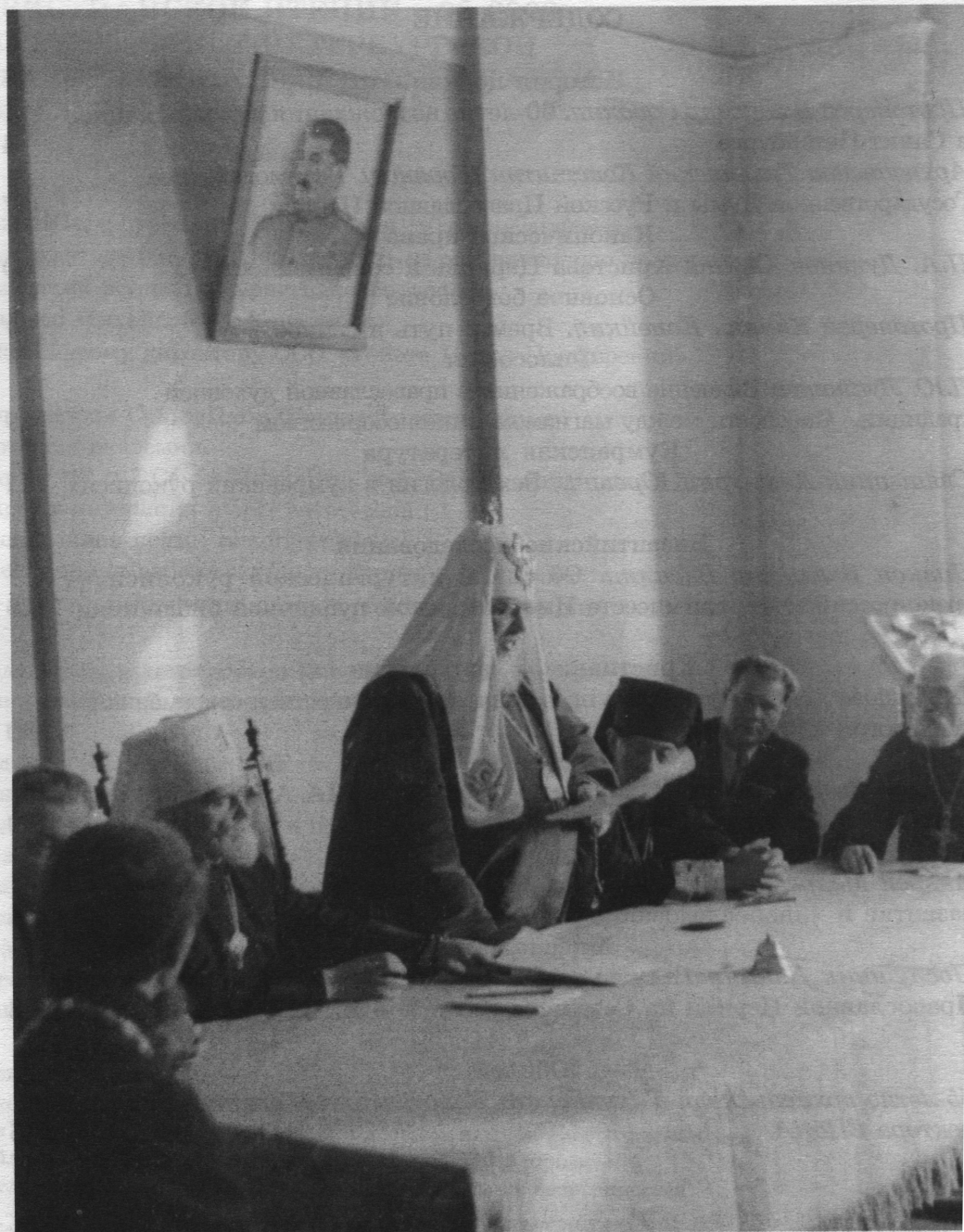
Выступление Святейшего Патриарха Московского и Всея Руси Алексия I (14 октября 1946 года)