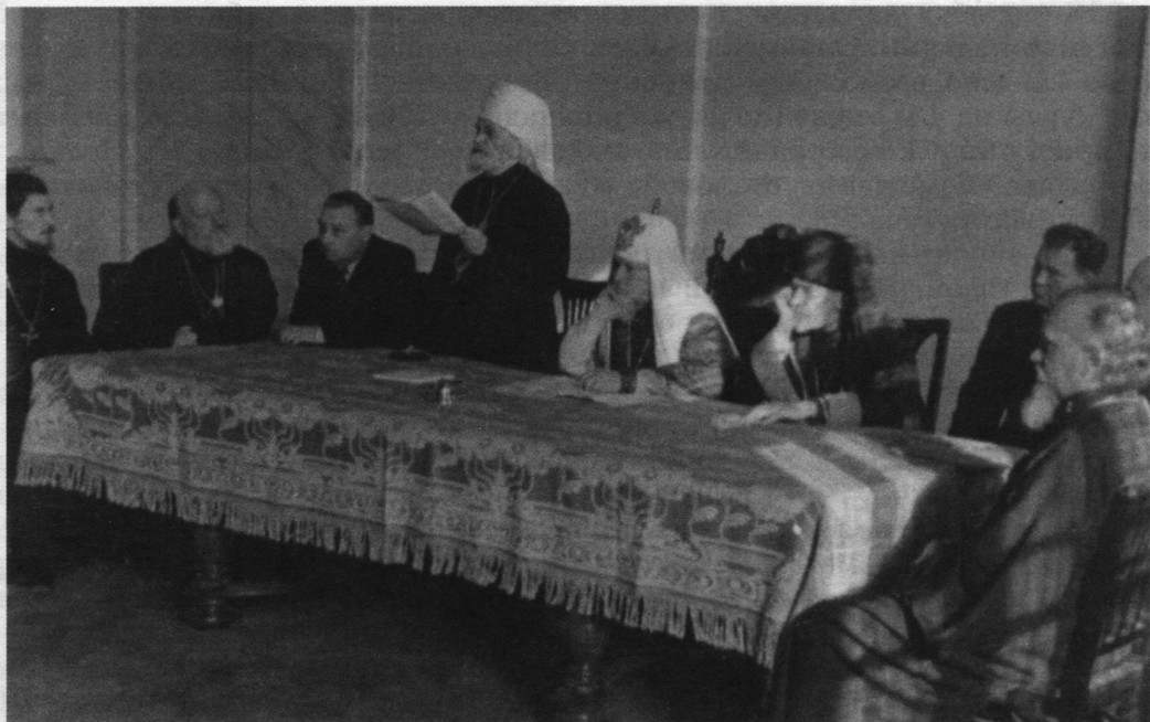
Выступление Митрополита Ленинградского и Новгородского Григория (Чукова) 14 октября 1946 года на торжественном открытии семинарии и академии

Уполномоченный по делам РПЦ по Ленингр. области поставил пред Ленсоветом вопрос о передаче этого здания для нужд курсов.