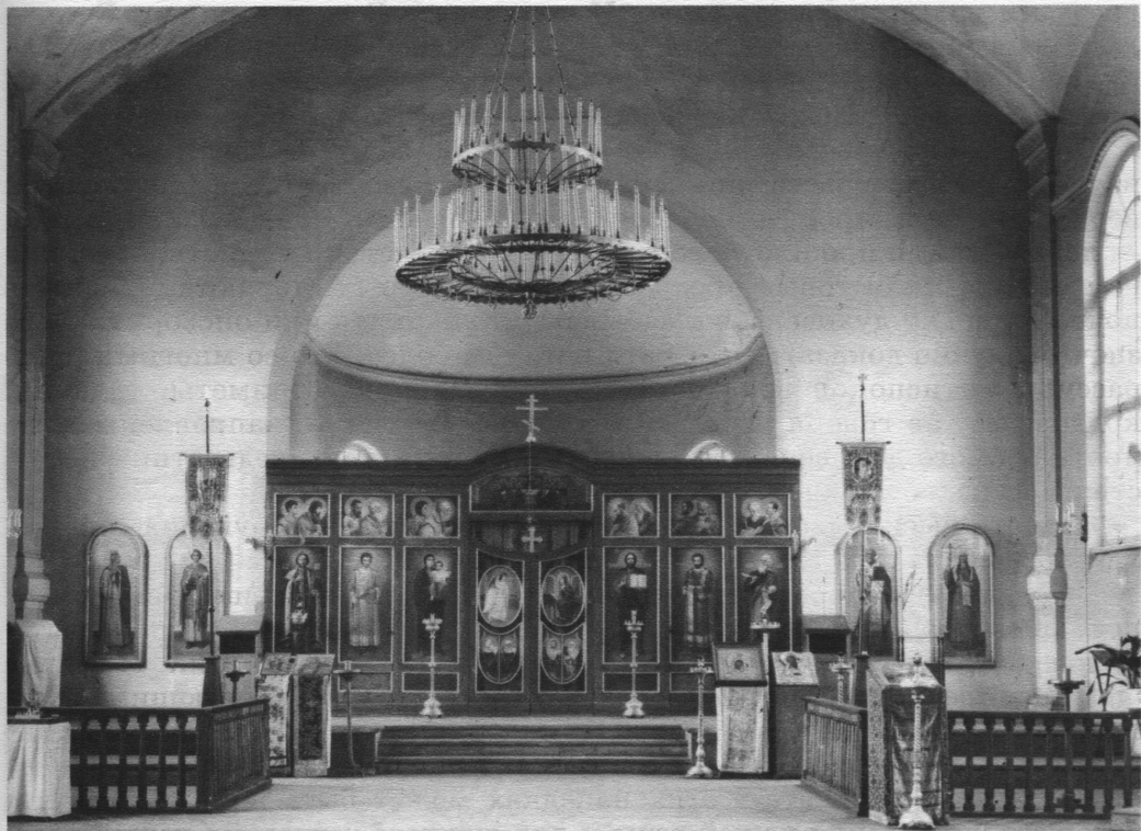
Интерьер академического храма Апостола и Евангелиста Иоанна Богослова. Фото 1948 года

Как относиться к этому нам, характер занятий которых весь сосредоточен на религии?