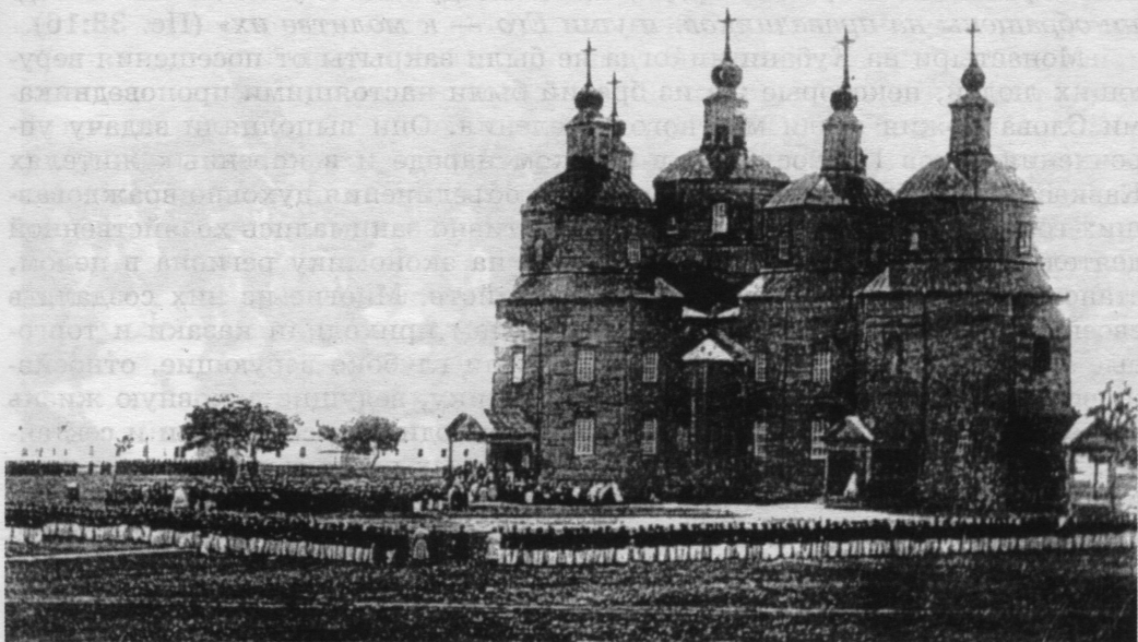
Воскресенский собор в Екатеринодаре