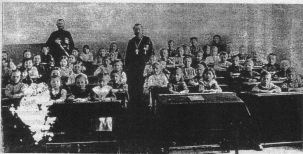
Церковноприходская школа в станице Уманской. Урок закона Божия. Кон. XIX в.