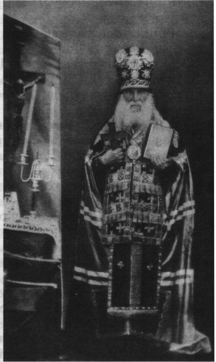
Епископ Иеремия, Кавказский и Черноморский

вать на человеческие немощи. Но люди с поверхностным понятием о христианстве признают восторженность и ревность святостью. Такая ревность — самое ненадежное оружие против зараженных лжеучением. Ревность и раскол — грехи ума. Как каждый образ мысли сопутствуется и содействуется сообразным ему духом или состоянием сердечным, так ересь и раскол всегда сопровождаются ожесточением сердца, ревность способна усилить это ожесточение. Желая успешно сражаться против ереси, сказал некоторый духовный писатель, — должен быть вполне чужд тщеславия и вражды к ближнему, чтобы не выразить их какою-либо насмешкою, каким-либо колким или жестоким словом, каким-либо словом блестящим, могущим отозваться в душе еретика, возбудить и возмутить в ней страсть ее. Помазуй струп и язву ближнего, как бы цельным елеем, единственно словами любви и смирения, да зрит милосердный Господь на любовь твою и на смирение твое, да востыются они сердцу ближнего твоего и да даруется тебе великий Божий — спасение ближнего твоего. Гордость, дерзость и упорство, восторженность еретика имеют только вид энергии, в сущности они — немощь, нуждающаяся в благоразумном соболезновании. Эта немощь только ножеется и свирепеет, когда против нее действуют безрассудною решительностью, выражающеюся жестоким обличением. Таков, по мнению моего современника, должен быть характер деятельности православного архиерея по отношению к ереси и расколу». 47