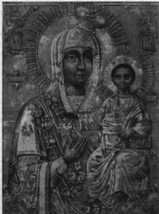
Моздокско-Иверская икона Божией Матери