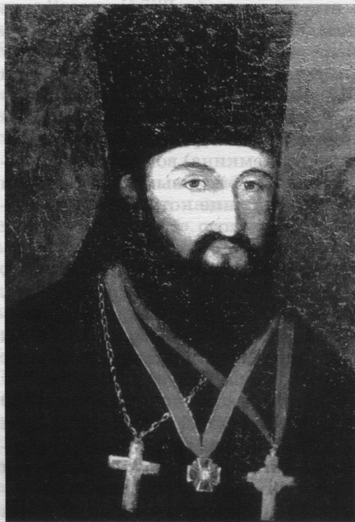
Протоиерей Кирилл Россинский

ховенство с прихожанами, и повышало ответственность первого перед обществом. Духовенство, избранное из казачьей среды навсегда оставалось с казачьим сословием, получало земли наравне с другими». 24 Оно жило одной жизнью с казаками, благодаря чему хорошо знало все их духовные нужды. «Между ними было органическое, кровное родство, что выгодно отличало духовных пастырей Черномории от остальных русских губерний, где к концу XVIII в. духовенство уже превратилось в замкнутое сословие. Духовные пастыри Черномории были старшими и наиболее почитаемыми членами куренной семьи». 25 Казаки считали их своими и относились к ним с полным доверием. В свою очередь служители Церкви всегда шли навстречу им. Так шел процесс формирования казачьего духовенства, среди которого было немало людей, пользовавшихся любовью народа и умевших врачевать духовные язвы добрым сло-