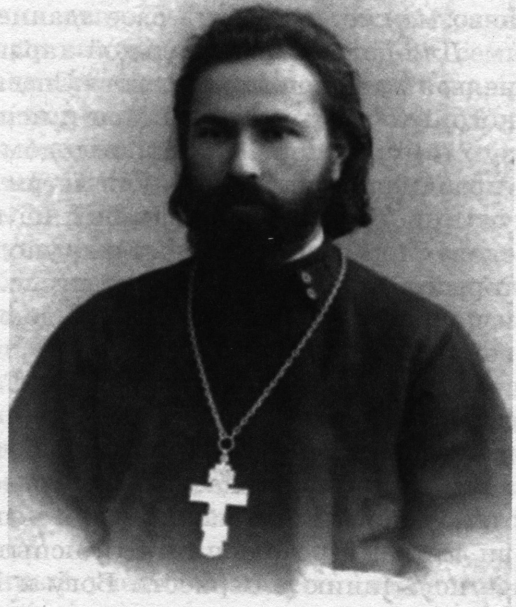
о. Георгий Гапон

Не о такой ли славе мечтал Г. Гапон, не осознавший своего предназначения, растративший данные ему Богом дары — пытливый ум, чистую совесть, физическое здоровье. Он, как блудный сын, прожил все свои духовные богатства в том возрасте, в котором студент Иван Сергиев тихо, спокойно и внешне незаметно созидал фундамент для здания своего великого будущего пастырства на патрологии и догматике Православной Церкви. Гапон к догматическому богословию относился изначально пренебрежительно, об изучении Святых Отцов