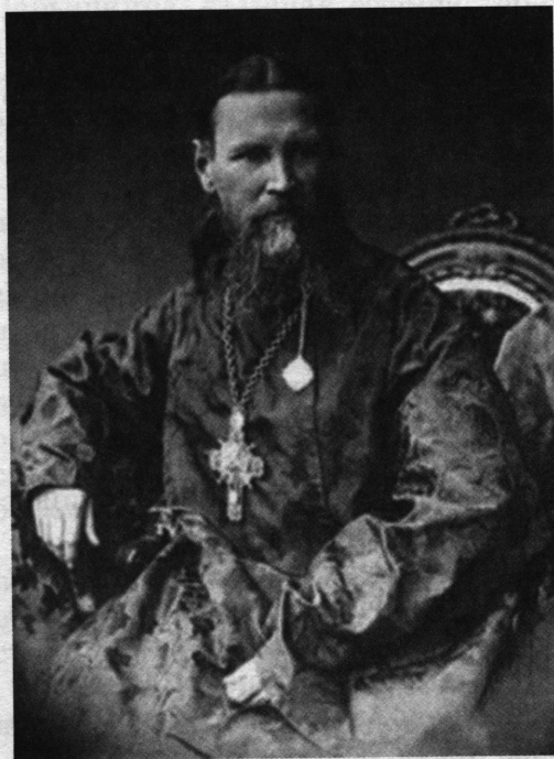
Святой праведный Иоанн Кронштадтский

Летом 1903 года Гапон заканчивает Санкт-Петербургскую духовную академию и защищает кандидатскую диссертацию «Современное положение прихода в православных церквях греческой и русской» 62 . По месту направления он не поехал и, отказавшись от места преподавателя в провинциальной семинарии, целиком ушел в рабочее движение.