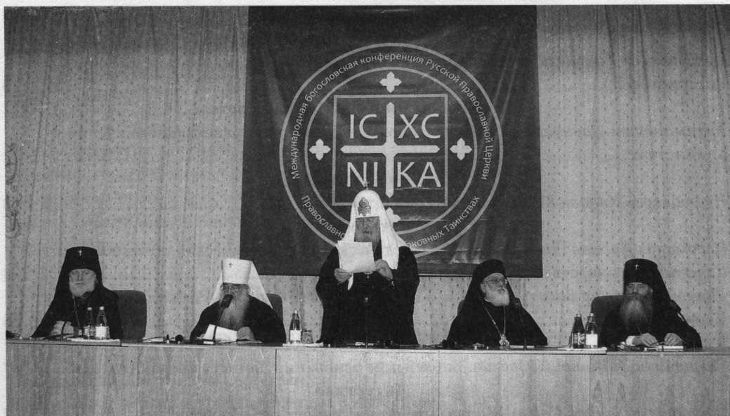
V Международная богословская конференция Русской Православной Церкви «Православное учение о церковных Таинствах»