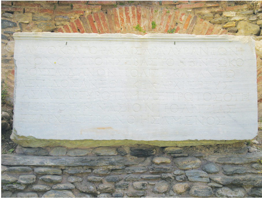
Рис. 3. Мраморная дарственная плита о даровании городу Сардису статуса «неокорос» (хранитель храма) от императора Антонина Пия

Порой против иудеев возникали локальные гонения — известно письмо Цицерона «В защиту Луция Валерия Флакка» 7 , в котором он оправдывает малоазийского губернатора Флакка, арестовавшего годовую десятину фригийских евреев для Иерусалимского храма — 15 000 серебряных драхм. Эти деньги Флакк пытался изъять в неурожайный для Фригии 62 г. до Р.Х., но Рим приказал воздержаться от притеснений иудеев.