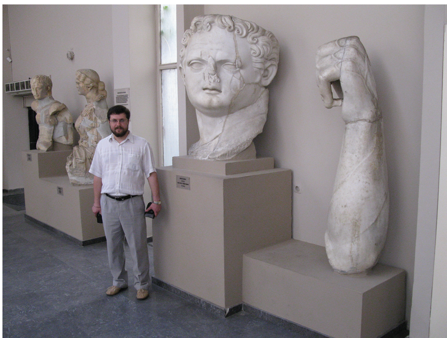
Рис. 5. Фрагмент семиметровой статуи Домициана, установленной при жизни в его храме (Ефесский археологический музей)

торжествах извещалось отдельно. Ритуал императорского культа соблюдался во всех мелочах и проходил с обязательным участием всех жителей — каждый лично должен был засвидетельствовать свою лояльность. Наряду с официальными днями отдыха, дни почитания императора также объявлялись выходными 20 .