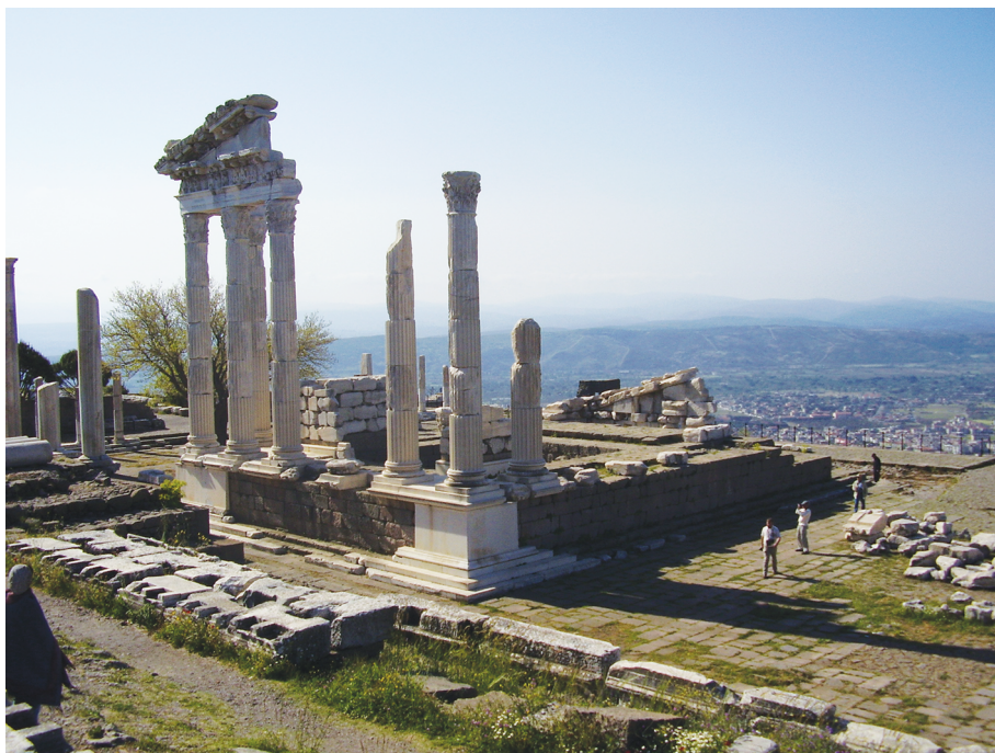
Рис. 6. Руины храма императора Траяна в Пергаме

серьёзная проблема — вкушение такого мяса рассматривалось как идолослужение. Беднейшие слои языческого общества питали отвращение к христианам за их отказ участвовать в культе, так как это означало то, что какие-то граждане города отвергали богов-покровителей, которые, в свою очередь, будут мстить городу за непочитание всяческими бедствиями.