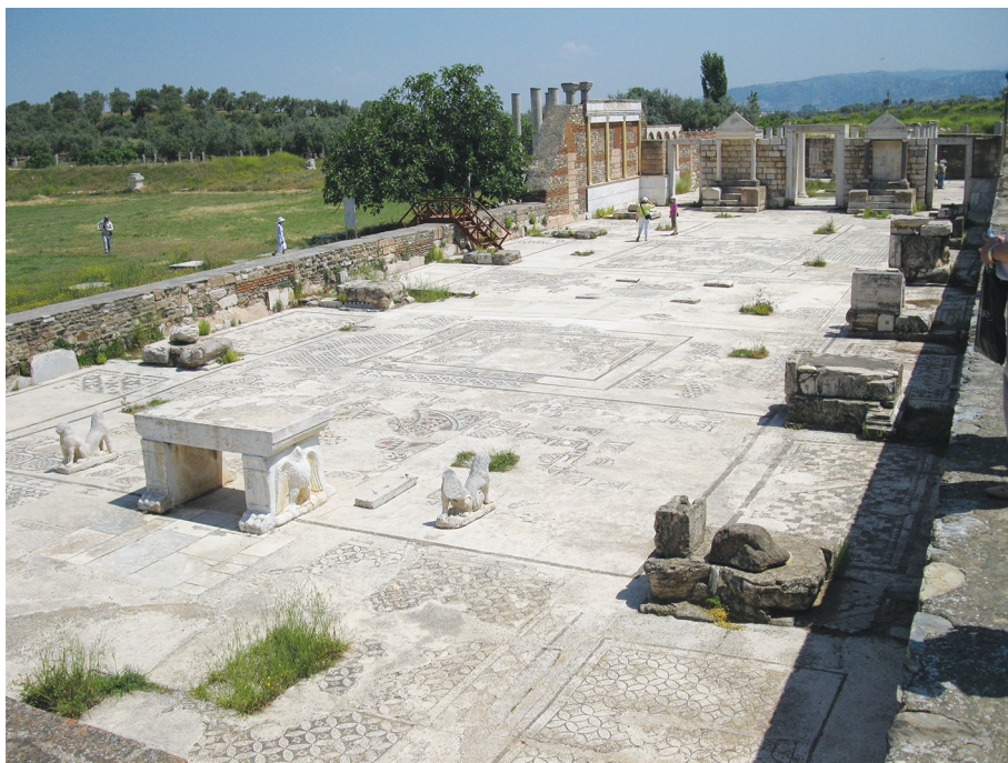
Рис. 2. Синагога в Сардисе, построенная во II в. по Р.Х.

археологами — чётко прочтываются восемь римских чиновников консульского ранга, один прокуратор и один имперский финансовый администратор, а на стене синагогального комплекса находится памятная мраморная доска сообщающая, что император Аврелий Антонин (Антонин Пий, 138–161 г. по Р.Х.) дарует городу Сардису титул «неокорос» (хранитель храма). Этот титул давался городу за особую лояльность к Риму и за строительство храма (в данном случае синагоги), который выступал в роли идеологического центра римской власти 6 .