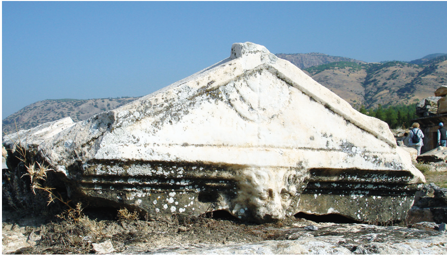
Рис. 1. Иудейский саркофаг в некрополе Иераполя Фригийского

Иосиф Флавий также сообщает, что император Август Октавиан издал закон, согласно которому иудеям было разрешено собирать деньги (десятину) для Иерусалимского храма и иметь своё судопроизводство (Иудейские древности. 14) 5 . Иудеи в глазах римской власти были абсолютно легитимны, и, более того, есть примеры, подтверждённые археологическими раскопками, что порой синагоги строились на деньги римской власти. Наглядным доказательством этой удивительной лояльности римских властей к иудеям (и, естественно, наоборот) может служить возведённая во II в. синагога в Сардисе, не уступающая размерами храму Артемиды и построенная благодаря материальной поддержке римской власти.