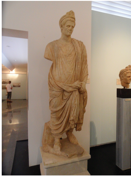
Рис. 4. Жрец императорского культа (Музей г. Афродисиас)

надцать городов, с одинаковою настойчивостью, но не с равными основаниями. Все они опирались на сходные доводы, ссылаясь на свое древнее происхождение, на преданность римскому народу в войнах с Персеем, Аристоником и другими царями. Но Гипепа, Тралла и вместе с ними Лаодикея и Магнесия сразу же были отвергнуты, как города незначительные. В отношении пергамцев было сочтено, что с них довольно существующего в их городе храма Августа, хотя именно это и было их главным доводом. Милет и Ефес отпали, потому что первый и без того совершает священнодействия Аполлону, а второй — Диане (Артемиде). Итак, оставалось выбрать лишь между Сардами и Смирной. Жители Сард упоминали о грамотах, данных им нашими полководцами, о заключенных с нами во время Македонской войны договорах, протекающих у