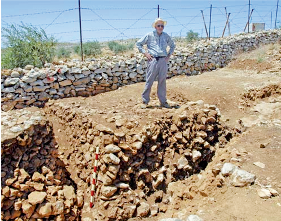
Рис. 5. Стена крепости в Хирбет эль-Макатире в западной части сохранилась высотой до 1,2 м 28

7) ворота на севере Гая (Нав 8:11) соответствуют северным воротам указанной крепости;