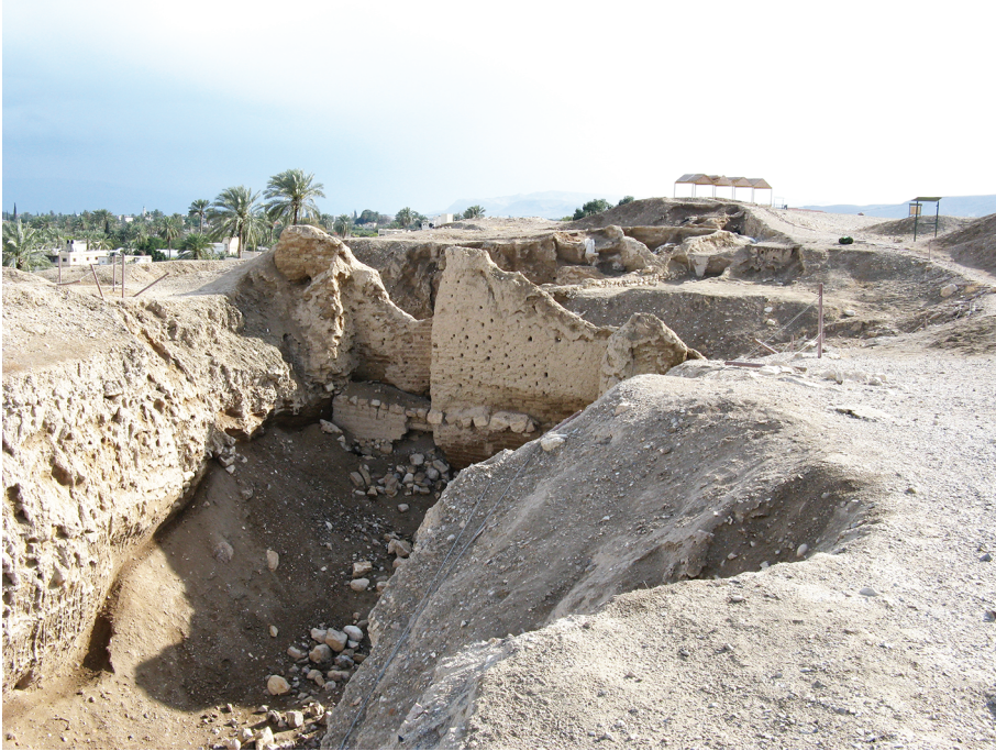
Рис. 1. Раскоп в Иерихоне

ней бронзы (примерно 1550 г. до Р.Х.) 13 . Эта датировка К. Кеньон стала считаться окончательной и стала приводиться как хрестоматийный пример несоответствия библейского повествования научным данным 14 . Окончательные отчеты раскопок К. Кеньон в Иерихоне были опубликованы только в 1981–1983 гг. (после ее смерти в 1978 г.) 15 . В начале 1990-х гг. Б.Г. Вуд (B.G. Wood) проанализировал эти отчеты, сопоставив их