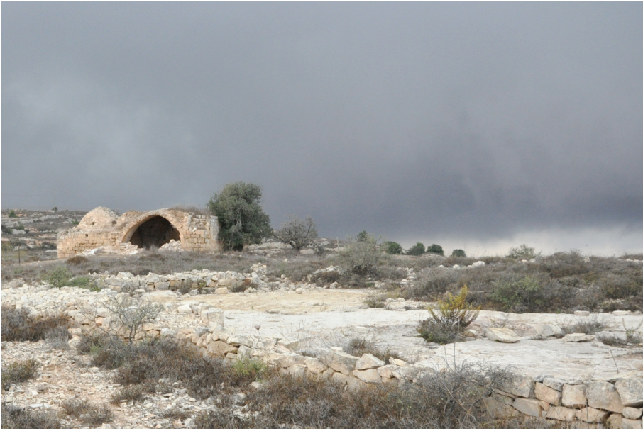
Рис. 2. Бейтин (Beitin)

жены в качестве кандидатов библейского Гая: Khirbet Haiyan (на юг), Khirbet Khudriya (на восток) и et-Tell (на северо-запад) 18 . Наиболее предпочтительным из всех кандидатов стал et-Tell, поскольку этот вариант идентификации поддержал У.Ф. Олбрайт 19 . Однако раскопки показали, что данное место не было заселено в период между 2400 и 1220 гг. до Р.Х. 20 Каменные постройки периода железа I в et-Tell рассматриваются некоторыми исследователями как свидетельство поселения там изра-