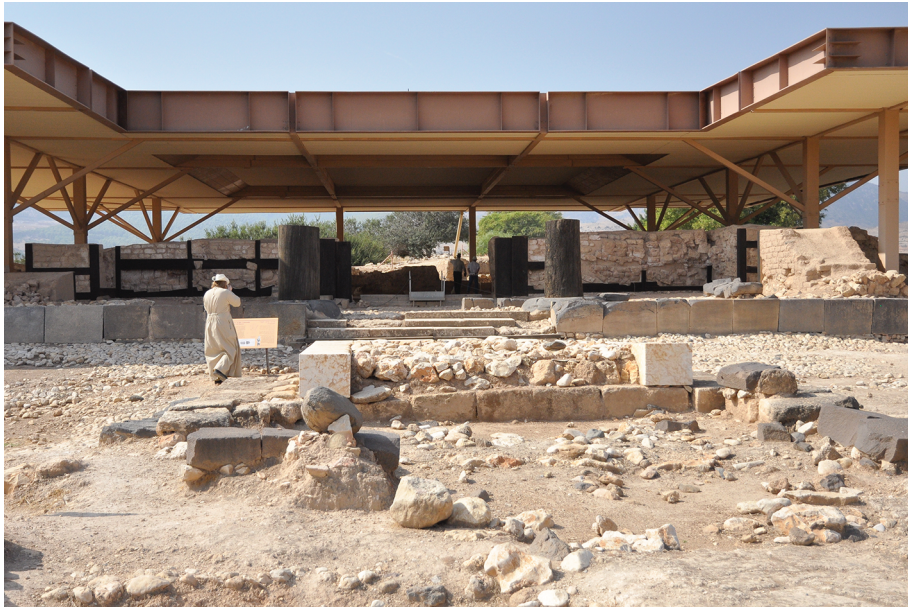
Рис. 6. Дворец в Хацоре

сл. четвертью XIII в. и связал его с деятельностью Иисуса Навина 34 , что соответствует поздней датировке вхождения евреев в Ханаан.