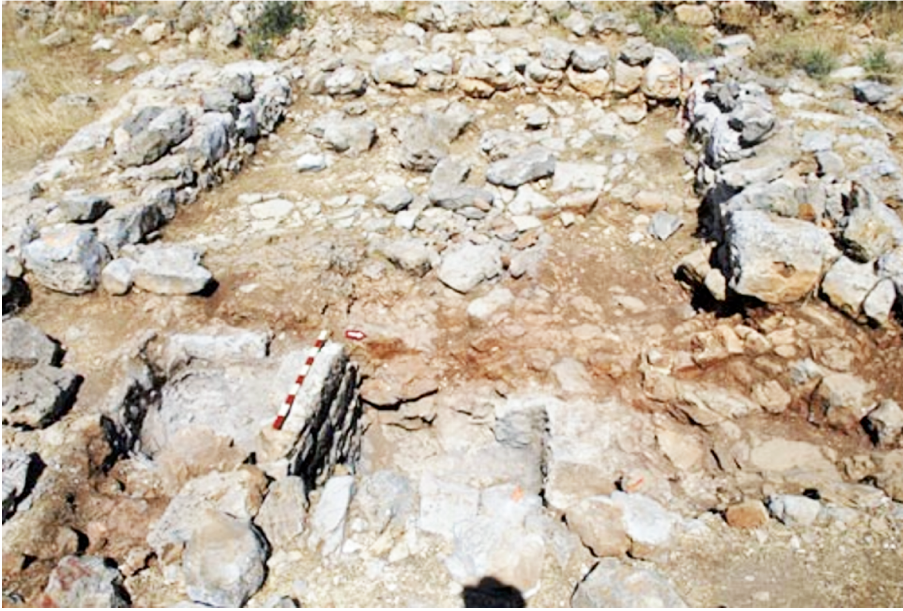
Рис. 4. Ворота в Хирбет эль-Макатире 24

возможность исследователям предположить, что идентификация Гая с et-Tell не является корректной 25 .