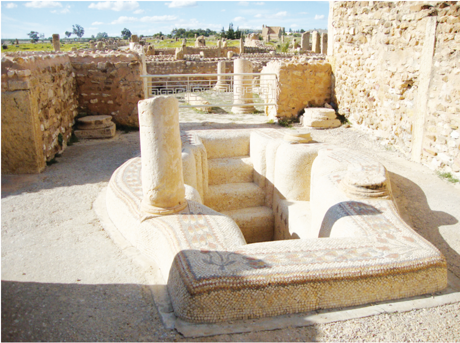
Рис. 10. Баптистерий вблизи языческого центра в Суфетуле

не было установлено господство арабов. Впрочем, арабы быстро забросили Суфетулу и в этих местах снова стали обитать кочевники-берберы.