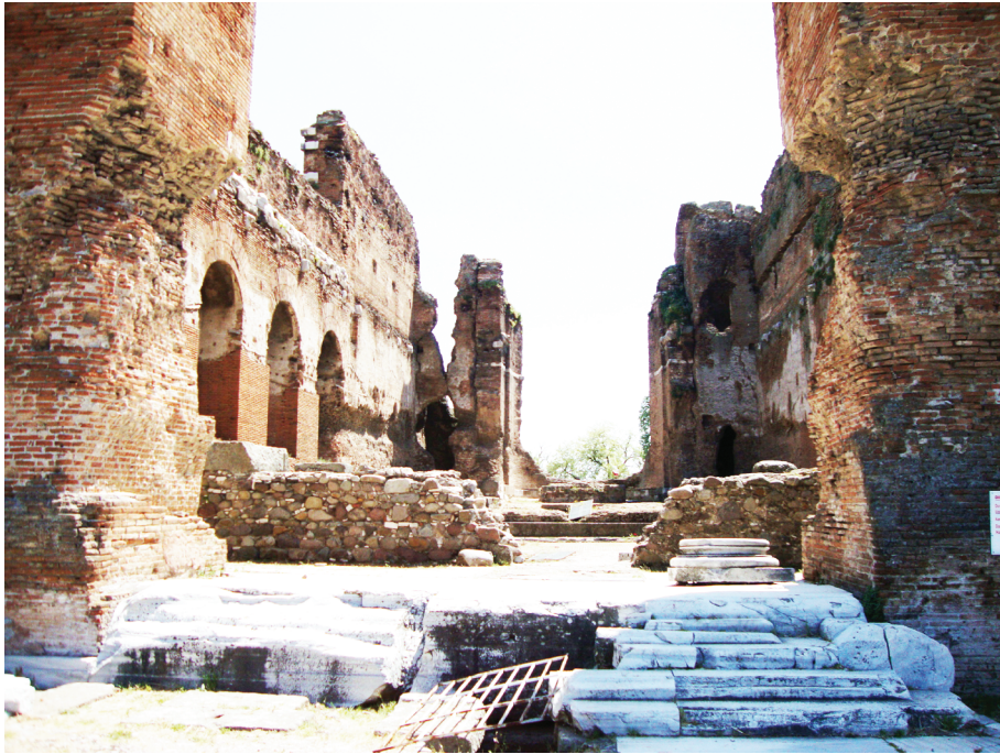
Рис. 6. «Красный двор» в Пергаме

тельствовать и в пользу того, что непосредственно в пределах языческого храма могли совершаться христианские богослужения.