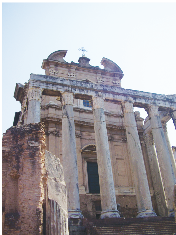
Рис. 2. Храм Антонина и Фаустины. Рим. Форум

Лоренцо-ин-Миранда. В настоящее время к храму ведет лестница с кирпичным алтарем по центру. Пронаос, предвещающий вход в храм, образован коринфскими колоннами из мрамора с прожилками — шесть по фасаду и по две боковых. На некоторых колоннах выгравированы изображения божеств; на фризе — грифоны и растительные мотивы. В VII в. храм был переделан в христианскую церковь 8 . Считается, что на этом месте был замучен Святой Лаврентий, от чего и произошло название церкви.