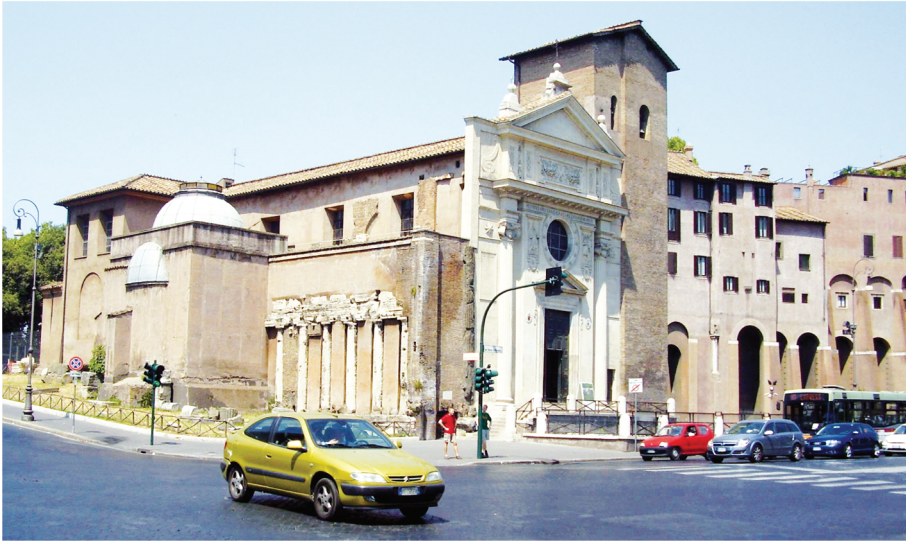
Рис. 3. Церковь св. Николая Чудотворца «в темнице». Рим

Слово же Миранда произошло, как полагают, от понятия благотельница.