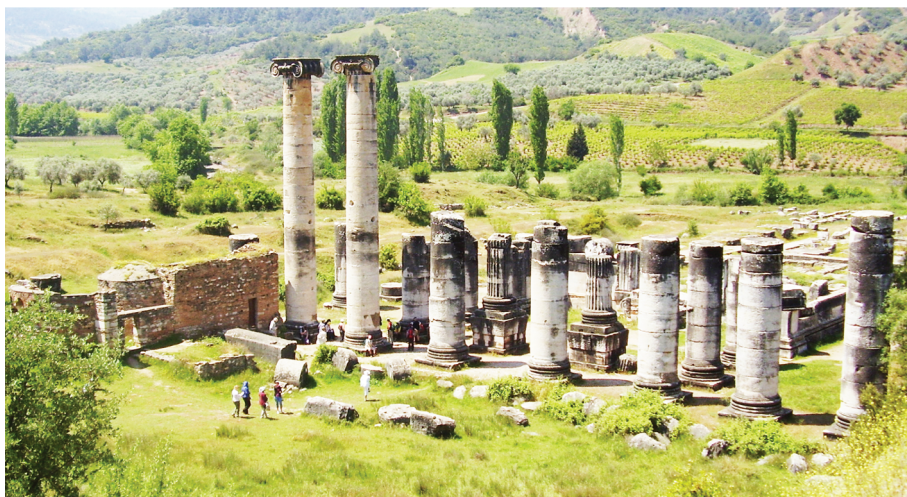
Рис. 5. Храм Артемиды в Сардах

стианская община была здесь не такой богатой и многочисленной, как в Ефесе. Тем не менее, уже в IV в. в непосредственной близости с языческим храмом христиане возводят небольшую базилику, не демонстрируя никакого намерения превзойти монументальностью античное творение. Вместе с тем, близость языческого святилища заставила христиан оградить себя от возможного «влияния» со стороны «демонов», которые ассоциировались с языческими культурами. С этой целью входы в сакральную часть Артемиды и само внутреннее пространство святилища были наполнены христианскими знаками и текстами. Прежде всего, это чёткие, прорезанные в мраморе кресты, напоминающие изображение голгофы в православной традиции, а также обрывки фраз, указывающие на влияние Евангелия св. Иоанна Богослова — «жизнь» (ζωή) и «свет» (φῶς). Сам же храм, как считают исследователи, так и не был никогда превращен в церковь, хотя наличие «охранных» христианских надписей может свиде-