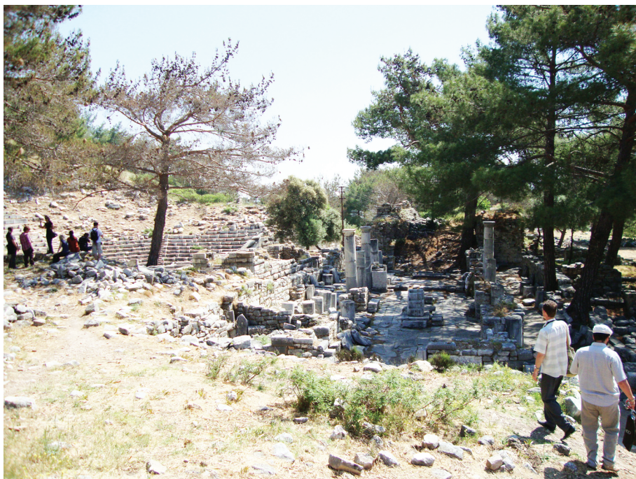
Рис. 8. Церковь и примыкающий к ней театр в Приене

во многих других известных городах Малой Азии, однако прямых доказательств этому нет в нашем распоряжении.