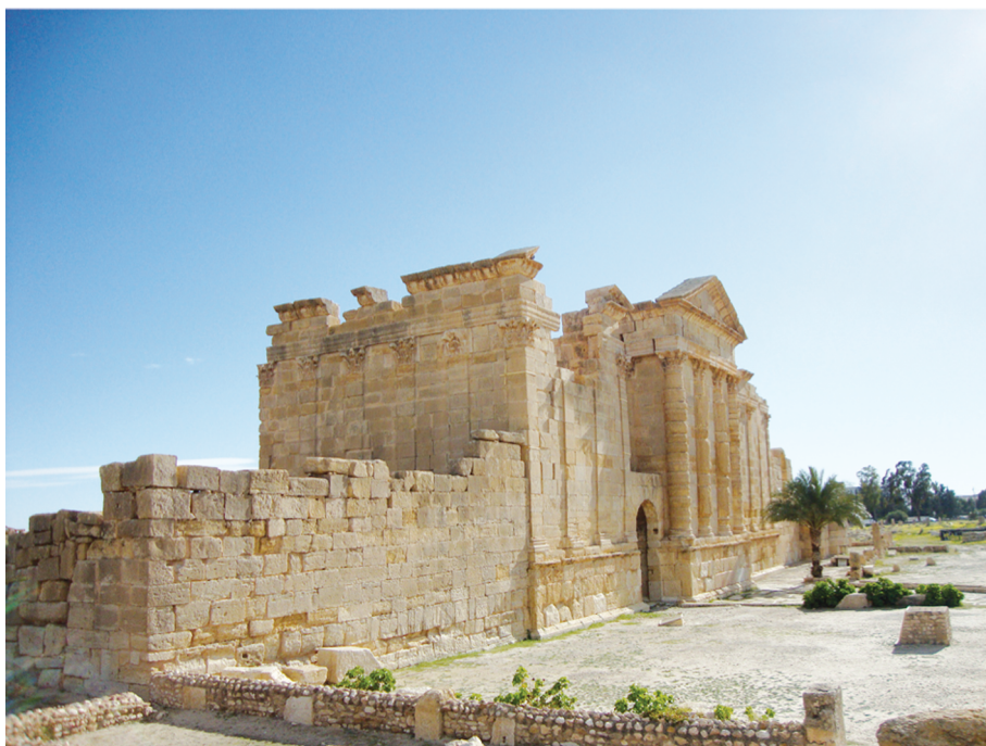
Рис. 9. Храм Капитолийской Триады в Суфетуле. Тунис

обращенной на юг и выходящей на форум, но представлял собой единый фасад, обращенный к северной части города.