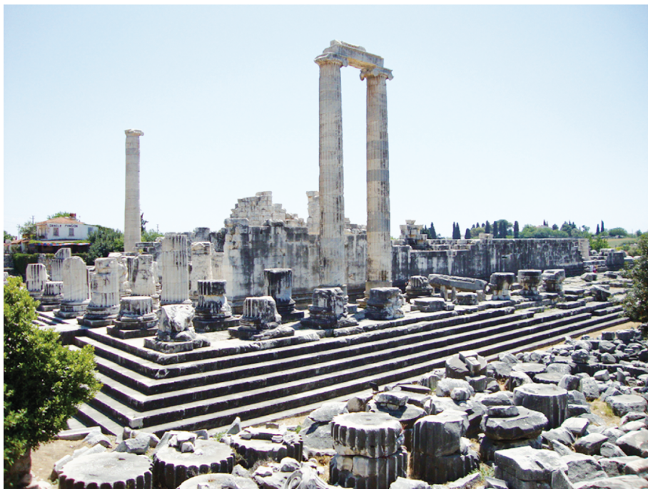
Рис. 7. Храм Аполлона в Дидиме

В ранневизантийский период после разрушения Серапеума в Александрии и указа императора Феодосия I о запрещении языческих культов пергамский Серапеум был преобразован в христианскую церковь, которая, будучи обрамленной высокими стенами из красного кирпича, получила название «Красный двор». Обустройство места христианского богослужения в непосредственной близости от пьедестала, на котором незадолго до этого возвышалась 10-метровая статуя Исиды и Сераписа, прислоненных спинами друг к другу, свидетельствует о стремлении пергамских христиан продемонстрировать силу своей веры и ее преимущество над ушедшими в прошлое языческими богами.