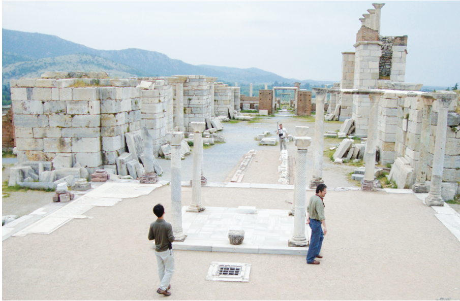
Рис. 4. Храм Иоанна Богослова в Ефесе

ности. При Юстиниане решено было покончить с последними напоминаниями о былом величии языческой богини, и руины храма Артемиды были использованы на строительство храма Святой Софии в Константинополе, а также, видимо, и самого храма Иоанна Богослова. Вероятно, возведение столь грандиозного сооружения, каким стал храм Иоанна Богослова в Ефесе, имело целью подчеркнуть своей монументальностью превосходство над языческим чудом света, которое, по словам Плиния Старшего 14 , имело «всего» 105 м в длину и 51 м в ширину, а ионические колонны, обрамлявшие святилище, достигали 18 м в высоту.